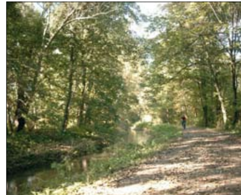
Wabe-Aue bei Querum

kennt, dem mag leicht verständlich sein, wenn hier vom Paradies geträumt wird: Von einer naturnahen Landschaft, die Ruhe verschafft, zum Verweilen einlädt und manchen sogar Geborgenheit und Glücksgefühle vermittelt, insbesondere dann, wenn die Umgebung fast märchenhaft erscheint. Auf einem Weg, begrenzt von Wasser, begleitet von blühenden Pflanzen am Wegesrand und umarmt von Sträuchern und Bäumen. Dieses Bild ist in Auen von Bächen und Flüssen zu erleben.