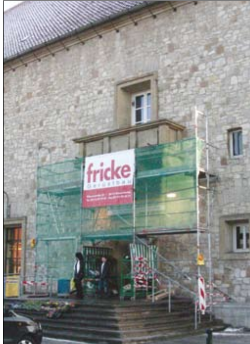
Der Eingangsbereich des Görge-Marktes im Roxy ist bis auf weiteres durch ein Gerüst vor Steinschlag geschützt.