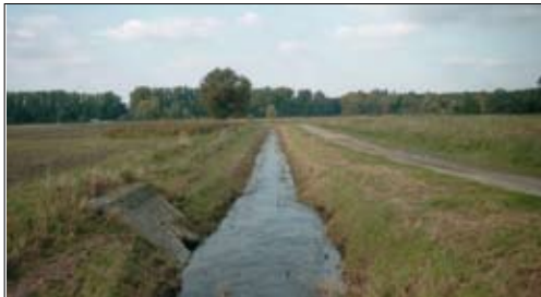
Kanalartiger Verlauf der Mittelriede

■ Die Mittelriede ist eine künstliche Abzweigung der Wabe am Schöppenstedter Turm.