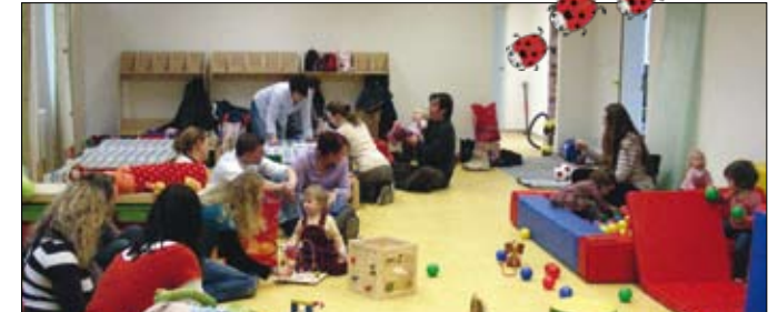
Die tollen Räume der Kinderkrippe Marienkäfer e.V. begeistern Groß und Klein.

Im August wird die nächste Gruppe mit 15 Kindern eröffnet, für beide Gruppen nehmen wir noch Anmeldungen entgegen. Die Kinderkrippe Marienkäfer befindet sich zwischen Rautheim und Lindenberg in der ehemaligen