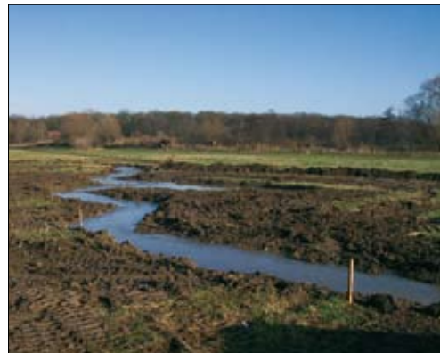
Naturnaher Gewässerverlauf im Wabetal nach dem Schöppenstedter Turm.

Ausgehoben wurde ein neuer Flusslauf, der sich nun neben dem kanalartigen Verlauf der Mittelriede wohl fühlend durch die Landschaft schlängeln kann. Die Landschaft ist insgesamt neu und naturnah modelliert worden.