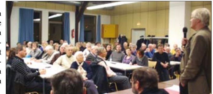
Volles Haus bei der Bürgerinitiative am 3. März.

Professor Sievers rechnete vor, dass die Angaben zu bebauten und versiegelten Flächen einer Überprüfung nicht standhielten. So sind die angesetzten Grundflächen für das Hotel zu klein, nicht einmal 50 Parkplätze sind eingerechnet und notwendige technische Gebäude nicht berücksichtigt.