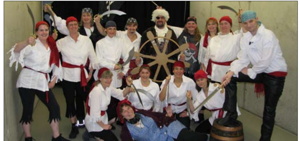
Am 10. Januar eröffnete eine Piraten-Truppe unter der Leitung des SV Lindenberg das Feuerwerk der Turnkunst 2010. Das Team bestand aus Mitgliedern vieler Vereine und einigen Import-Highlights aus „Fluch der Karibik“, wie z.B. Käpt'n Jack Sparrow.

Ausdrücklich würden sich die „Bounce Honeys“ über neue Gesichter freuen. Trainingszeit ist dienstags von 17.15 bis 18.15 Uhr in der Sporthalle Lindenberg.