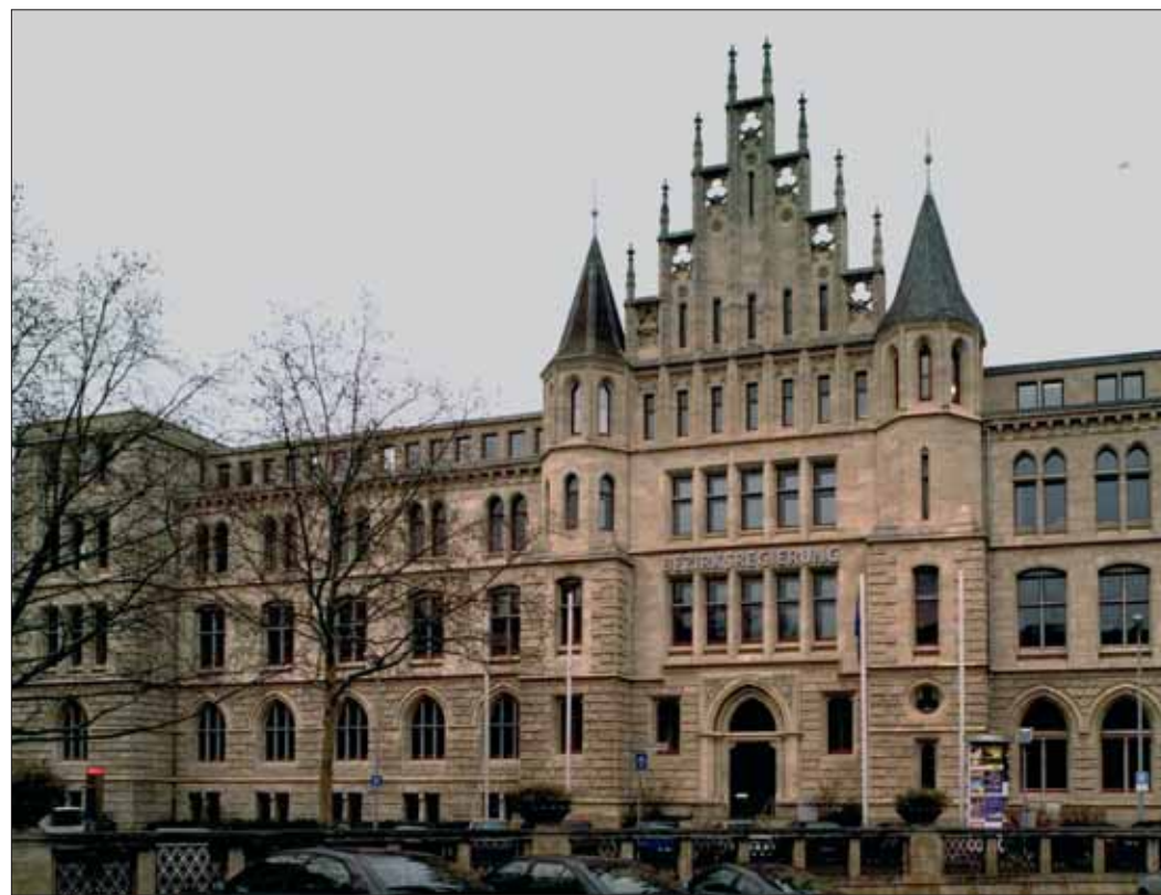
Das ehrwürdige Gebäude der ehemaligen Bezirksregierung am Ruhfütchenplatz.

Bittere Tatsache bleibt, dass auch die vier Braunschweiger CDU-Landtagsabgeordneten die Entscheidung mitgetragen haben – zum Schaden unserer Stadt.