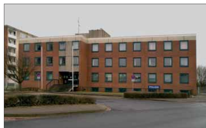
Nur noch Polizeistation mit geringer Personalstärke: Das ehemalige Polizeikommissariat im Heidberg.

Zu den Wahlversprechen der CDU vor der Landtagswahl 2003 gehört auch das Thema „Innere Sicherheit“. So versprachen ihre Landespolitiker, mehr Sicherheit durch mehr Polizisten zu schaffen. Aber nach der Wahl sollte die Einlösung dieses Versprechens kein Geld kosten. Und weil es keine Polizisten gibt, die bereit sind, zum Nulltarif zu arbeiten, behalf man sich mit einem Trick: Die Polizei wurden im Lande neu verteilt. In den ländlichen Regionen um Osnabrück und im Bereich Weser-Ems wurden mehr Polizisten eingesetzt, dafür wurden sie in den Großstädten Braunschweig und Hannover abgezogen: Auch hier wieder die unter CDU und FDP übliche Benachteiligung der Städte zu Gunsten des ländlichen Raumes. Das alles