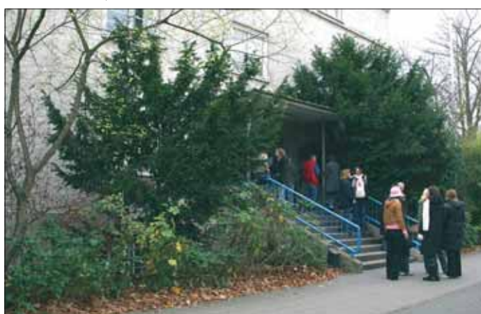
Schließt bald in Braunschweig: Der Fachbereich Sozialwesen der Fachhochschule Braunschweig-Wolfenbüttel.

So gibt es zwei Gewinner: die Stadt Wolfenbüttel, die ihre Fachhochschule bald für sich allein hat, und das Land Niedersachsen, das in das Fachhochschulgebäude in Braunschweig nicht mehr investieren muss. Verlierer ist die Stadt, die mittelfristig Arbeitsplätze, Studienplätze und Einwohner verliert. Für jeden Wirtschaftsbetrieb mit gleich hoher Bedeutung für die Wirtschaftskraft würden sich Stadtverwaltung und Kultusministerium ein Bein ausreißen. Und Verlierer ist auch die junge Generation, der weitere wichtige Ausbildungsplätze verloren gehen. Die junge Generation hat offensichtlich keine Lobby in der Landesregierung und im Rathaus.