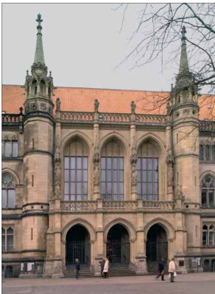
Politik zum Schaden der Stadt: Das ist die Handschrift der Braunschweiger Abgeordneten von CDU und FDP.

Wer nun glaubt, dass die vier Braunschweiger CDU-Landtagsabgeordneten etwa gegen diese Verschlechterung für Braunschweig gekämpft hätten, hat sich getäuscht: Selbstverständlich stimmten sie alle der Änderung des Finanzausgleichs zu. In ihren „Leistungsbilanzen“ wird diese Fehlleistung allerdings schamhaft verschwiegen. Sie bauen eben darauf, dass die Wähler die Feinheiten des Haushaltsrechtes nicht kennen. Leider scheint auch die örtliche Presse die Sache nicht für so wichtig zu halten – bedauerlich für unsere Stadt.